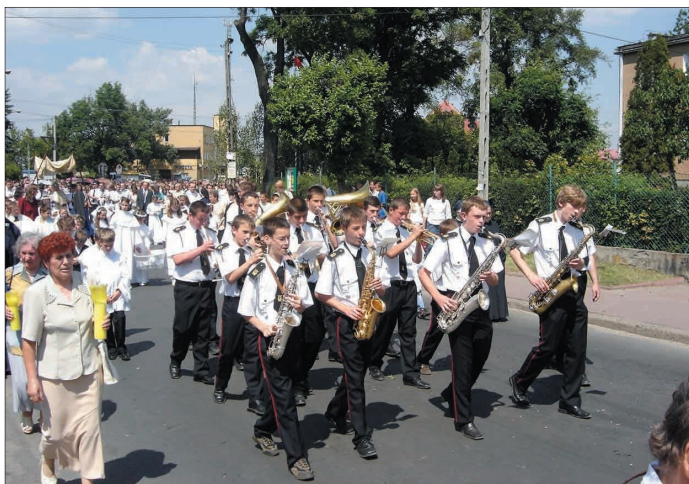
Orkiestra OSP podczas procesji Bożego Ciała w Chotomowie