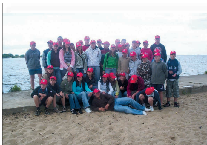
Mikoszewo 2007

Sprzęt: Obecna strażnica ma trzy boksy wjazdowe w których stoją - Jelcz 244 R 6 zabudowany w 1998 r. Star 266 zabudowany w 2002 r. Ford Transit 350 M zakupiony w 2003 r. oraz łódź motorowodna do ratownictwa wodnego zakupiona w 2004r. oraz SOP Polonez