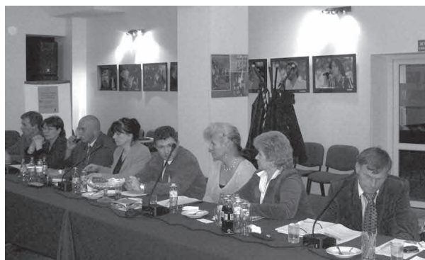
Fot. Radni głosowali za udzieleniem absolutorium

Udzielanie absolutorium Wójtowi Gminy odbywa się każdego roku. Dlatego też w dniu 8 kwietnia 2008 r. do Regionalnej Izby Obrachunkowej w Warszawie (RIO) wpłynął wniosek Komisji Rewizyjnej Rady Gminy Jabłonna o udzielenie absolutorium Wójtowi Gminy za rok 2007. Wraz z wnioskiem przesłana została opinia Komisji dotycząca wykonania budżetu gminy za rok ubiegły. W opinii Komisja Rewizyjna odniosła się do stopnia realizacji budżetu, a w szczególności dochodów i wydatków. Komisja pozytywnie opiniując sprawozdanie z realizacji budżetu, postanowiła wystąpić do