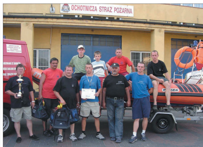
fot. Strażacy na tle łodzi motorowodnej do ratownictwa wodnego (archiwum OSP)