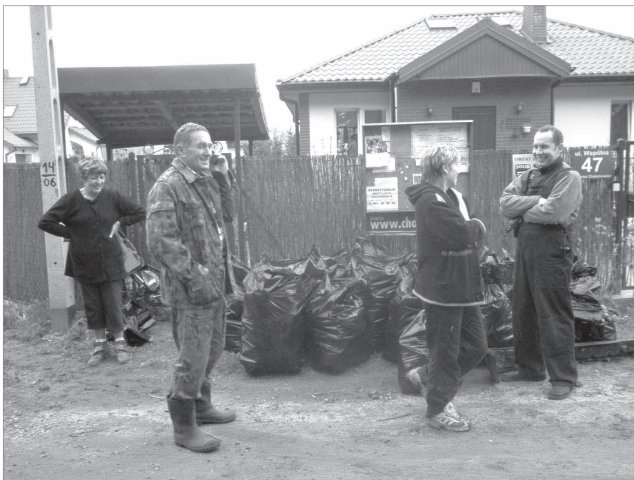
Akcja społeczna w Dąbrowie Chotomowskiej w sobotę 12 kwietnia 2008 r.