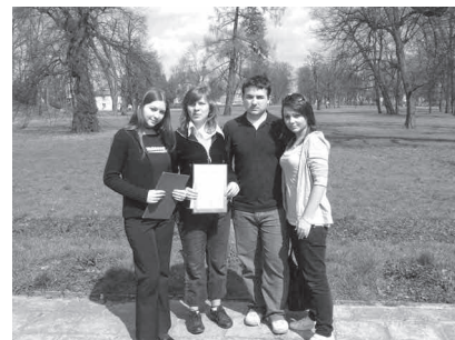
Fot. Nagrodzeni uczniowie z Gimnazjum im. Orła Białego w Jabłonie